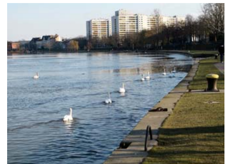
(Foto: „Rechts - Schwimmgebot“ für Schwäne auf dem Main bei Offenbach)

Zu den „ Stressessern “ dürften auch viele gehören, denn der Dauerstress gehört in irgendeiner Form zu den meisten Fibromyalgiebetroffenen. Die Anstrengung und Anspannung, die z. B. beim gewohnten perfektionistischen und fehlerfreien Arbeiten entstehen, will durch körperliche und geistige Entspannung ausgeglichen werden. Da dies während der Arbeit meistens nicht möglich ist, wird die „Schwäche“ mit kalorienreichen Energielieferanten (Nahrung) ausgeglichen. Man fühlt sich für einen gewissen Zeitraum wieder besser und kann weiterpowern. Mit der Zeit werden die Körperzeichen (Hungersignale) nicht mehr wahrgenommen und es wird einfach gegessen weil es dafür Zeit ist. Die Wahrnehmung der eigenen Körperzeichen tritt immer mehr in den Hintergrund. Wir trainieren uns um!