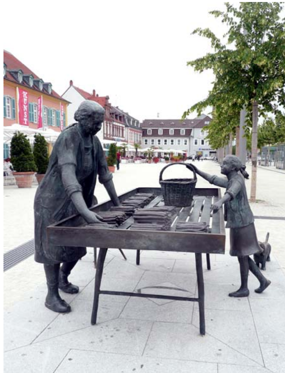
Haben Sie auch weißen Spargel? (Skulptur in HD-Schwetzingen)

Das „FM-Nachrichteblättche“ dient der fachlichen Unterstützung der Selbsthilfegruppen bei Ihrer Betreuungsarbeit mit Betroffenen und darf kopiert und weitergegeben werden.